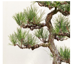
Eén van de vertakkingen

De eerste evangelische kerken in Vlaanderen dateren van voor WOI. De denominatie "Evangelische Christengemeenten Vlaanderen" (ECV) ontstond in 1972. Onze gemeente te Berchem was de eerste van deze nieuwe evangelische kerkengroep die op dit moment bestaat uit 20 gemeenten.