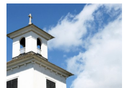
Variëteit aan kerken